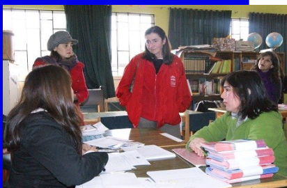
Profesionales de la Seremi de Bienes Nacionales llevan adelante el proceso de regularización express.

Cabe destacar que el C.R.E.A. es una instancia existente en cada región del país, la cual es presidida por el Secretario Regional Ministerial de Agricultura, y es dependiente de la Comisión Nacional de Emergencia Agrícola.