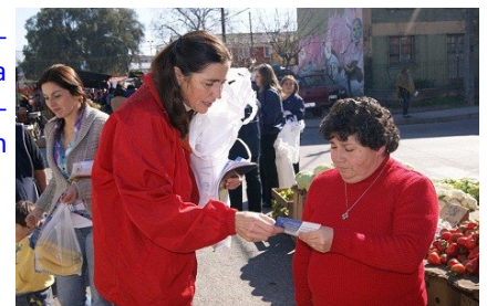
La Gobernadora de Cachapoal, entregó personalmente la información a cada uno de los vecinos.

dan realizar denuncias en forma totalmente anónimas y sin ningún tipo de temor