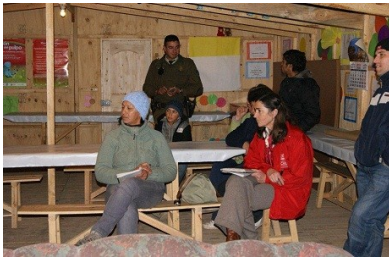
En la oportunidad estuvieron presentes la Gobernadora de Cachapoal, el Alcalde de Rengo, funcionario del Serviu y Carabineros de Chile

Respondiendo a una inquietud de los vecinos, y a través del trabajo realizado por el Ministerio de Vivienda, mediante el Plan Invierno enfocado a las Aldeas que se originaron producto del terremoto, se conformó una mesa de trabajo, la cual busca mejorar las