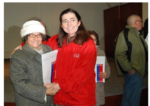
Ceremonia de entrega de certificados Fondos Senama 2011

Dependiendo de las características del proyecto y del tipo de organización que lo presente, los recursos varían entre $1 millón de pesos y los $2.500.000 pesos.